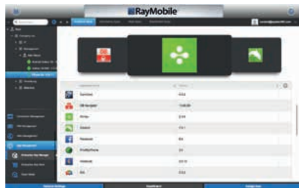
Verwalten Sie mit RayMobile Ihre Applikationen auf den mobilen Geräten