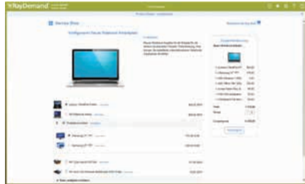
Konfiguration eines neuen Notebook-Arbeitsplatzes im Webportal

RayDemand unterstützt Sie bei der Senkung direkter und indirekter Kosten: Durch das Angebot standardisierter Services, durch Bündelung von Bestellvorgängen und durch eine reibungslose und automatisierte Service-Erbringung im IT-Betrieb.