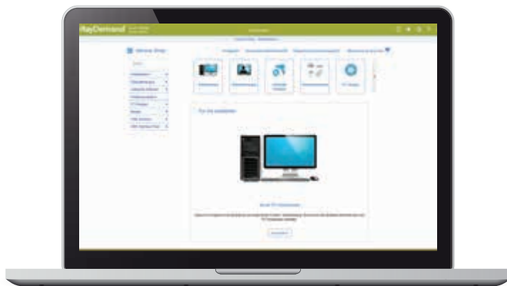
Personalisierte Produkte und Services zur Auswahl im Webportal

In vielen Unternehmen ist die Beschaffung von Hardware und Software sehr zeit- und kostenintensiv.