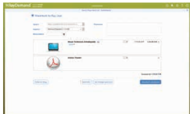
Zusammenfassung der ausgewählten Produkte und Services im Warenkorb