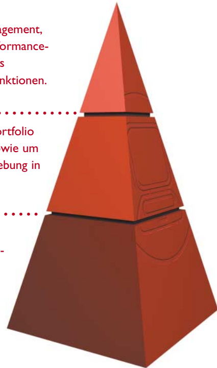
Die Lösungen von Altiris sind nach einem Maturity-Modell in 3 Ebenen gegliedert. Wenn sich Ihre Anforderungen ändern, können Sie das Funktionsspektrum jederzeit um die nächste Ebene erweitern.